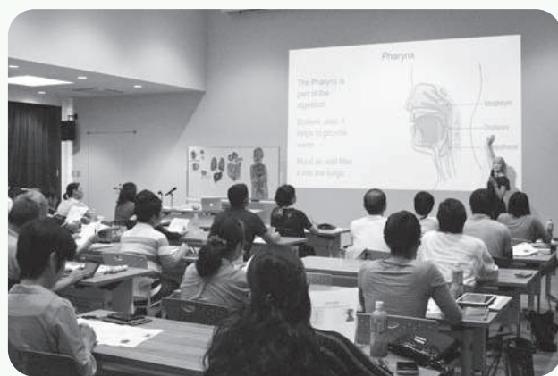
医療通訳ボランティア ステップアップ講座の様子