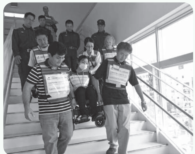
避難所運営訓練の様子