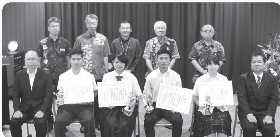
高校生の主張コンクール沖縄県地方大会の様子