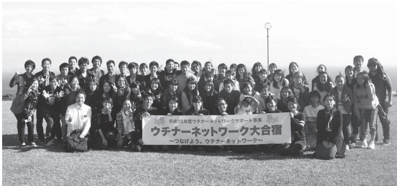
ウチナーネットワーク大合宿 於：国立沖縄青少年交流の家(渡嘉敷島)