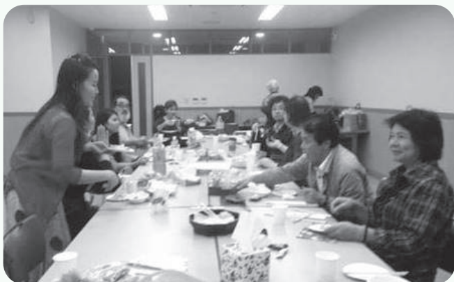
受講生同士の持ち寄りパーティー