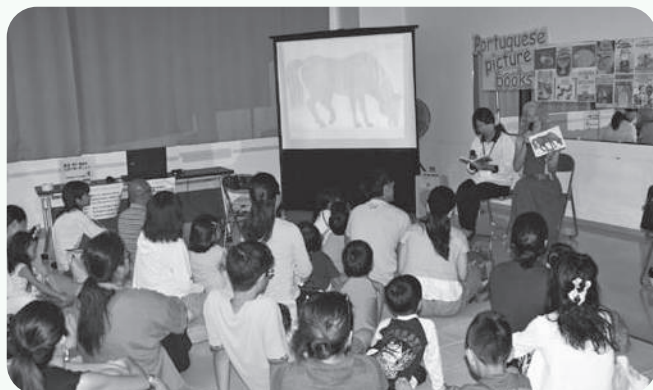
外国語絵本読み聞かせ教室の様子

ます。次年度はさらに多くの国を紹介できるような読み聞かせ教室を行っていきたいと思います。