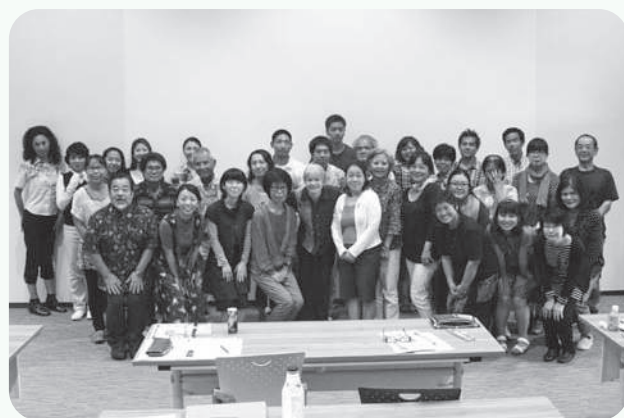
ステップアップ講座 受講者のみなさん