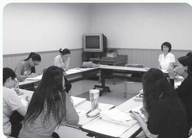
车 莉莉氏による医療通訳ボランティア講座の様子