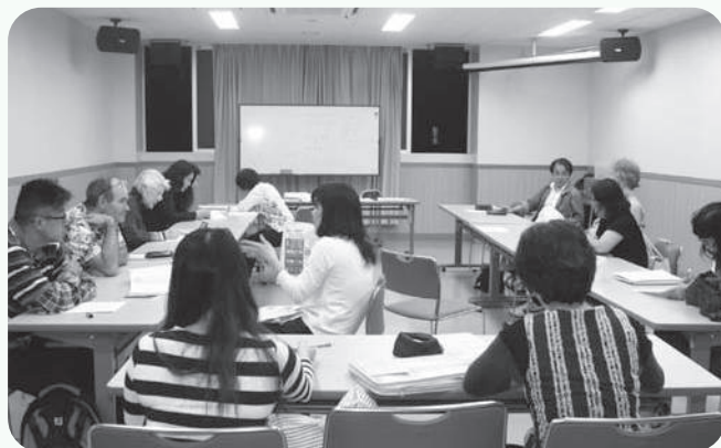
日本語読み書き教室の様子

習得を必要とする方です。小学1年生～6年生程度の漢字や、漢字を中心とした日常生活に必要な日本語の読み書きを中心に、毎週金曜日(夜 7:00～9:00)に実施しています。