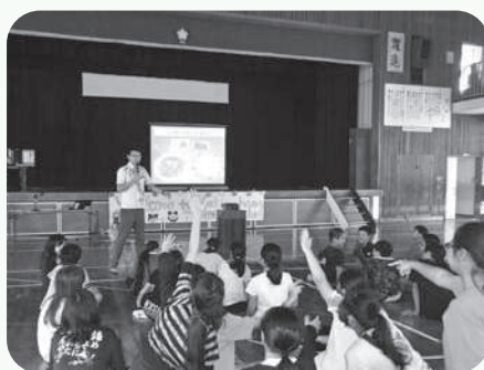
クイズによる文化紹介